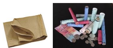
Sac de monnaie/Tube de monnaie